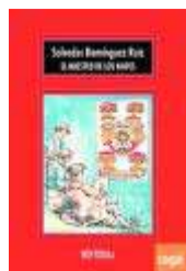
EL MAESTRO DE LOS NAIPES

Por Francisco Morales Lomas Diego Vaya ha publicado tanto poesía como narrativa habiendo obtenido importantes premios. Con 'Arde hasta el fin' crea una prosa condensada en torno a seis relatos cuyas fábulas poseen un hilo conductor concreto que nos permite adentrarnos por mundos urbanos insólitos con una narrativa sugerente capaz de crear sublimes emociones y manifiesta turbación, y donde nos podemos encontrar mundos plurales en el ámbito de internet, las reseñas o el diario cotidiano. Uno de los elementos más inquietantes es su capacidad para hacer cómplice al lector de esa enajenación en lo misterioso en donde los abusos o la depresión están presentes. El escritor les da un aire de unidad, pues a pesar de su autonomía, tienen condiciones que permiten esas líneas colaterales que ofrecen un aire fronterizo.