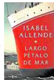
Largo pétalo de mar Isabel Allende. Plaza & Janés